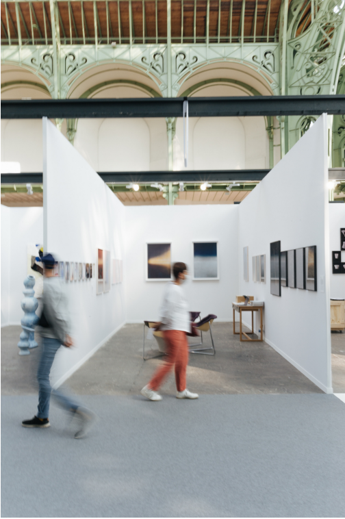
Legende : prise de vue du stand, Le Grand Palais, septembre 2020