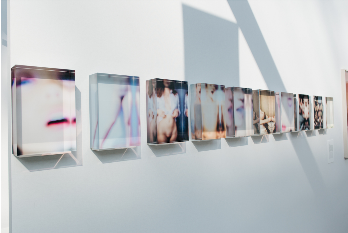
Legende : prise de vue du stand, Screenlove, Julien Mignot Le Grand Palais, septembre 2020